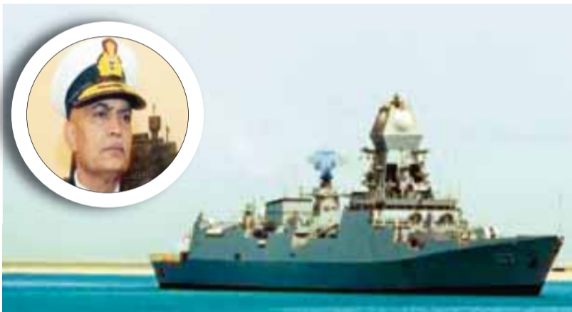
■ समुद्री सुरक्षा में तैनात किए 6 युद्धपोत अत्याधुनिक उपकरणों से लैस ■ अगर लुटेरे हरकतों से बाज नहीं आए तो किसी भी कीमत में हम छोड़ेंगे नहीं

समुद्री सुरक्षा में सख्ती बरतते हुए भारतीय नौसेना ने अरब सागर और अदन की खाड़ी में समुद्री डकैती और ड्रोन अभियानों को निर्यंत्रित करने के लिए 6 युद्धपोत तैनात कर दिए हैं। भारतीय नौसेना के प्रमुख एडमिरल आर हरि कुमार ने बताया कि यह तैनाती समुद्री क्षेत्र में उभरती चुनौतियों से निपटने के लिए एक व्यापक रणनीति हिस्से के रूप में किया गया है। नौसेना प्रमुख ने समुद्री युद्धपोतों की संख्या में बढ़ोतरी की आशा जताई है, जिसका प्रस्ताव सरकार को पहले ही भेजा जा चुका है।